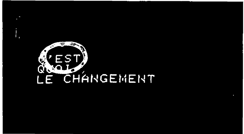
6 x 2 de Mieville et Godard.

C'est cette quête de ce qui est contemporain qui rend les films de Vertov aujourd'hui si précieux. Précieux comme documents historiques aussi. S'il s'était posé la question des militants éclairés (comment choisir dans le passé de quoi aider aux luttes du présent ?) il aurait cédé aux mornes fictions téléologiques et pleuses où le ci-